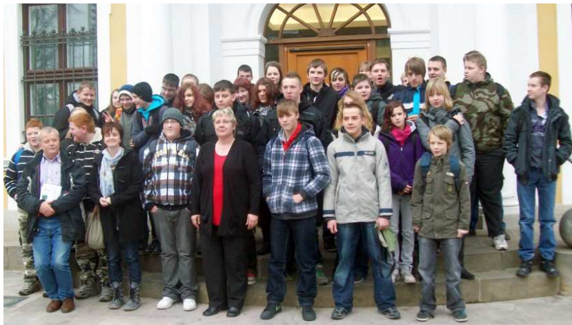
Es war für alle Beteiligten ein gelungener Tag. (Gruppenbild vor dem Landtag)

Nach einem Abschlussfoto vor dem Landtag, nutzten die Schülerinnen und Schüler die verbleibende Zeit bis zur Abfahrt des Busses, um sich auf dem Weihnachtsmarkt von Magdeburg umzusehen.